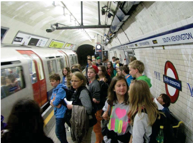
Die Klasse 7B In der Londoner Metro

Den Schülerinnen und Schülern wird die erfolgreiche Teilnahme am bilingualen Bildungsgang auf dem Abiturzeugnis sowie mit einem zusätzlichen Zertifikat bescheinigt. Neben verbesserten beruflichen Chancen im In- und Ausland genießen sie Vorteile bei der Aufnahme eines Studiums im englischsprachigen Ausland.