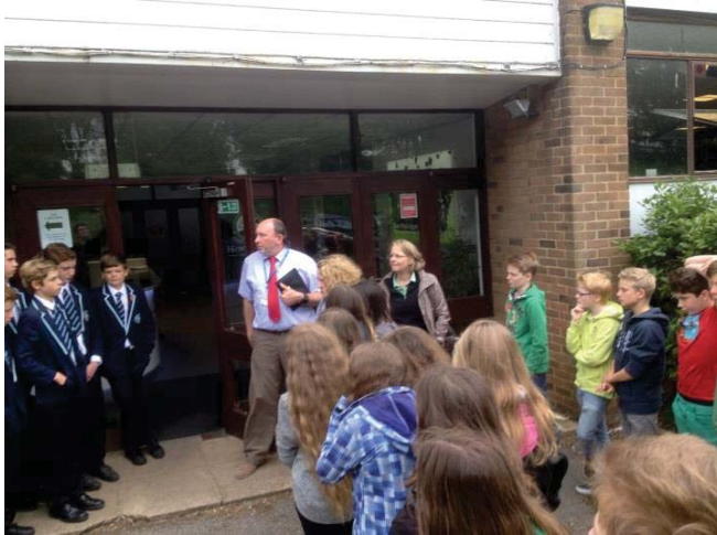
Besuch der Klasse 7B in der Hove Park School, Brighton 2014