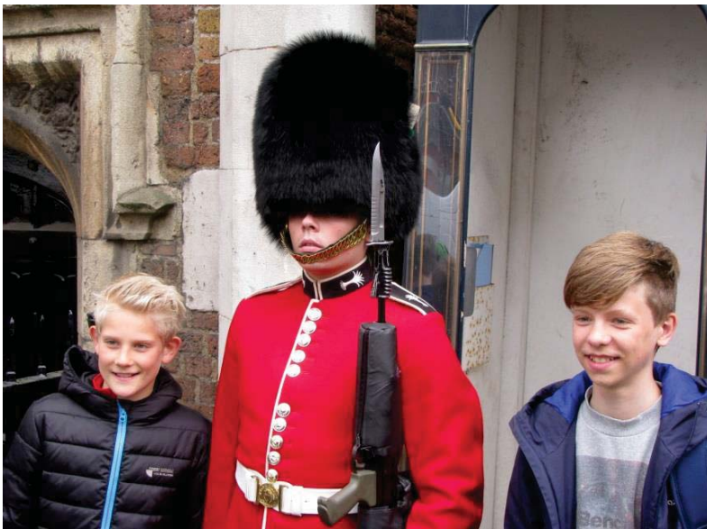
Die Klasse 7B in London 2014

In unserem bilingualen Bildungsgang hat die fachübergreifende Kooperation des Fremdsprachenunterrichts mit den bilingualen Sachfächern einen hohen Stellenwert, damit der Fremdsprachenunterricht den sprachlichen Fortschritt in den Sachfächern stützt und die erweiterten Sprachkenntnisse aus dem Sachfachunterricht in den Englischunterricht einfließen können.