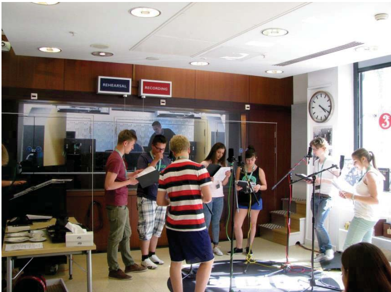
Studienfahrt nach London 2013 In den BBC-Studio's