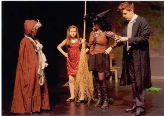
Szene aus dem englischsprachigen Theaterstück „Margolin and the Scared Crystal of Galloran“ (Aufführung der Drama-Group 2015)